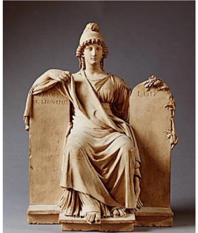
La République réalisée en terre cuite en 1794 par Joseph Chinard

L'unification des poids et mesures, gravure de 1793