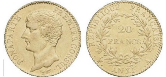
Le franc germinal

Victor Hugo, Discours à l'Académie française, le 3 juin 1841.