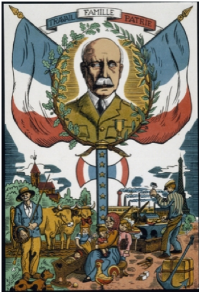
Affiche de propagande pour la révolution nationale en 1942