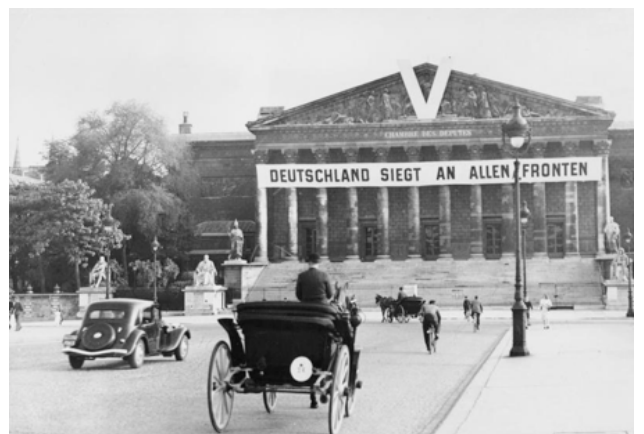
Assemblée nationale à Paris portant une affiche de propagande allemande en 1941 « L'Allemagne est victorieuse sur tous les fronts »

Marché noir : achat de produits échappant au contrôle du ravitaillement et coûtant très cher.