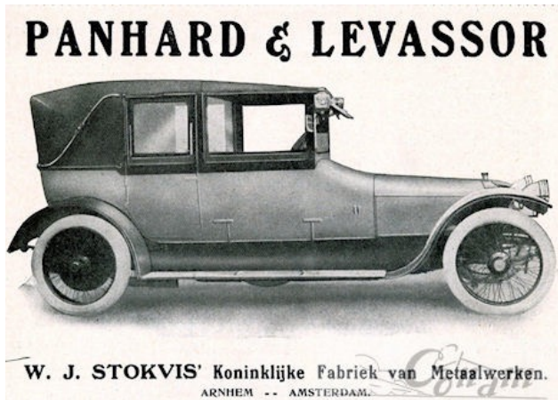
Une automobile française Panhard-Levassor de 1914.