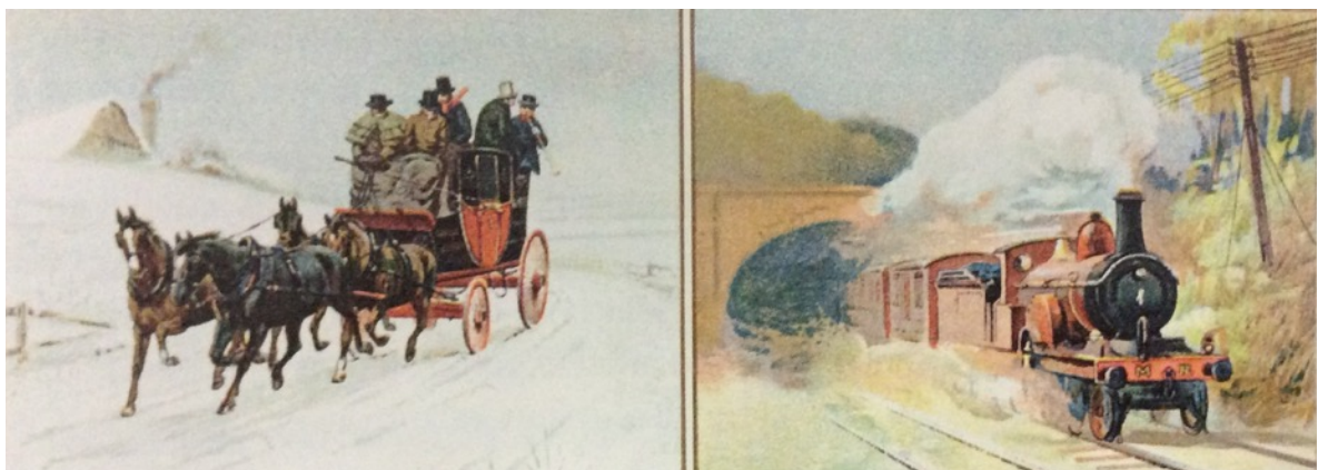
Avant et après la révolution des transports, illustrations de 1897.

Clément Ader a fait voler un premier engin en 1890 et lui a donné le nom d'«éole». Ses autres engins ont pirs le nom d'avion. Ce mot a servi ensuite à désigner tous les engins volants?