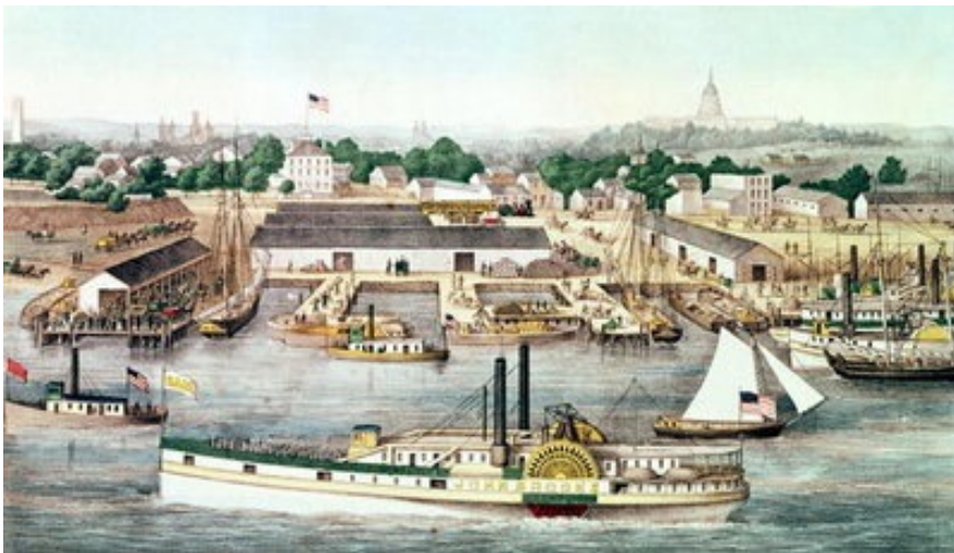
Un steamer illustré par Charles Magnus en 1863.

Clément Ader a fait voler un premier engin en 1890 et lui a donné le nom d'«éole». Ses autres engins ont pirs le nom d'avion. Ce mot a servi ensuite à désigner tous les engins volants?