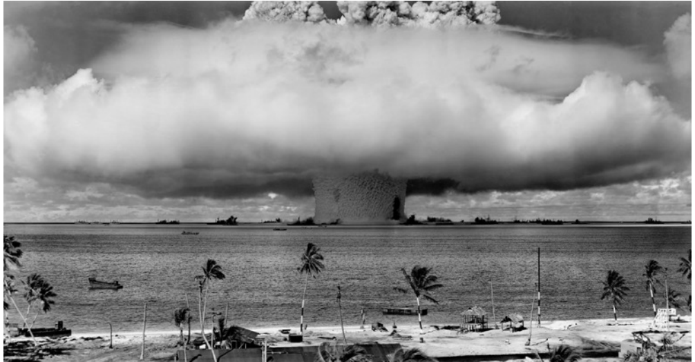
Essai nucléaire en 1946 des Etats-Unis.