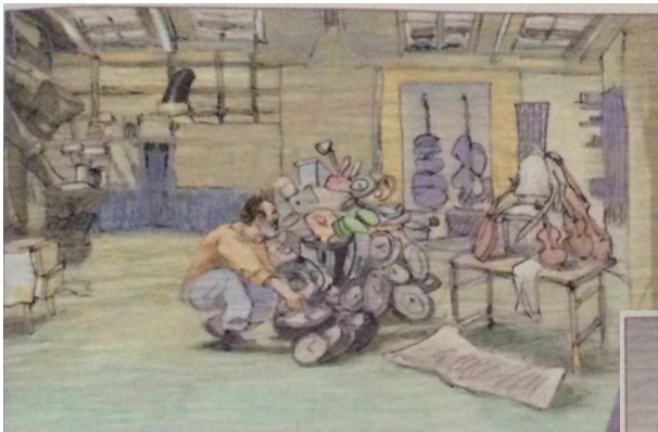
▲ Doc. 2 : La technique de l'artiste part de sa capacité à accumuler les choses. Les ateliers d'Arman étaient remplis d'objets divers.