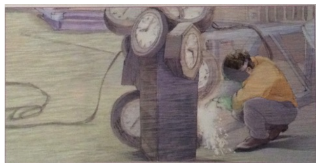
▲ Doc. 4 : Il assemble les objets selon différentes techniques. Pour cette sculpture, il a soudé les horloges entre elles sur un support.