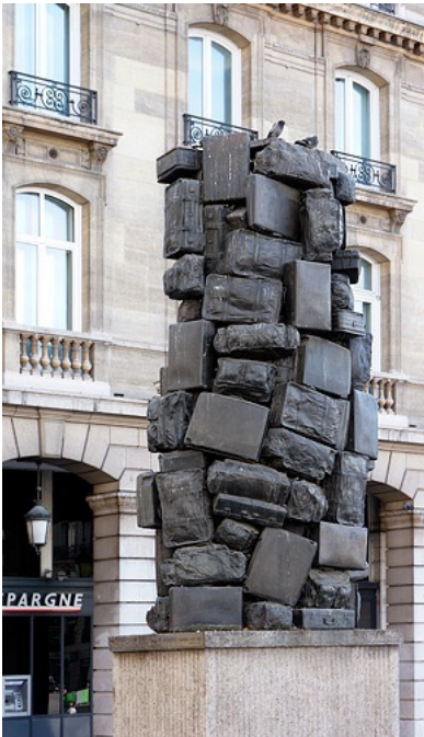
L'Heure de tous , 1985, Arman, bronze soudé, 457 x 152, 182 cm, gare Saint Lazare, Paris.

Dans l'autre cour de la gare, une seconde sculpture d'Arman représente une accumulation de valises et s'appelle Consigne à vie .