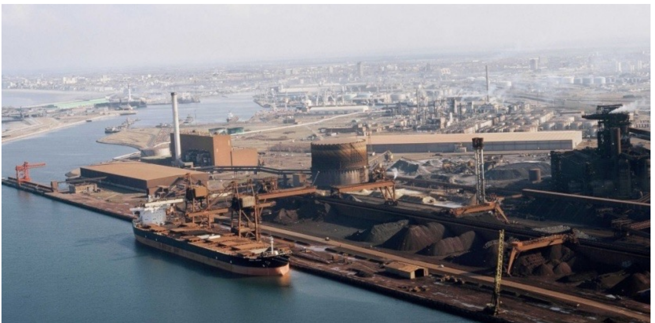
L'usine sidérurgique de Dunkerque