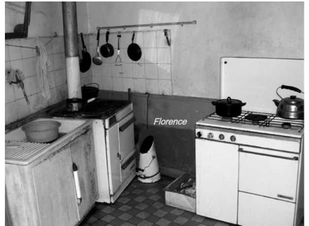
La cuisine dans les années 1950 et aujourd'hui.