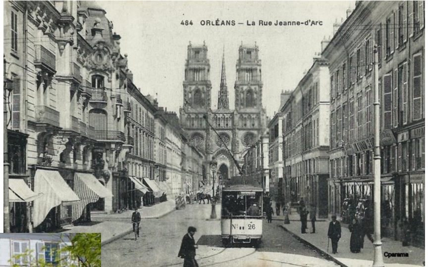
La rue Jeanne d'Arc à Orléans en 1950 et aujourd'hui.