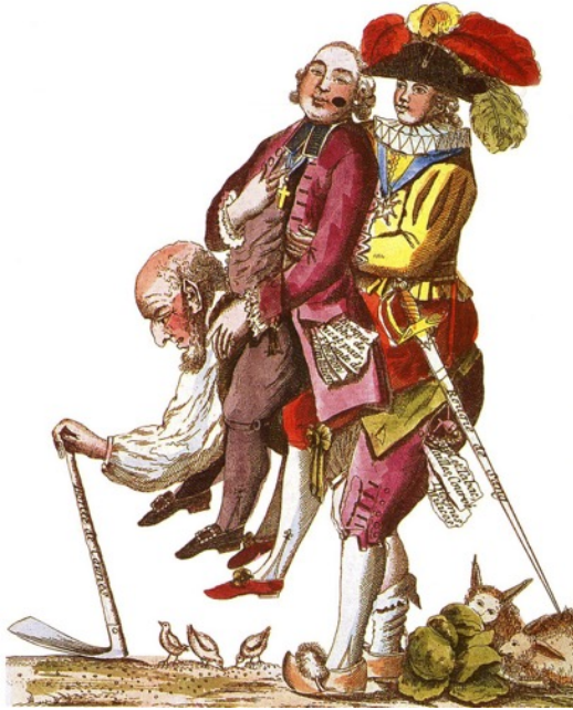
Le Tiers Etat soutient le clergé et la noblesse, caricature de 1789.