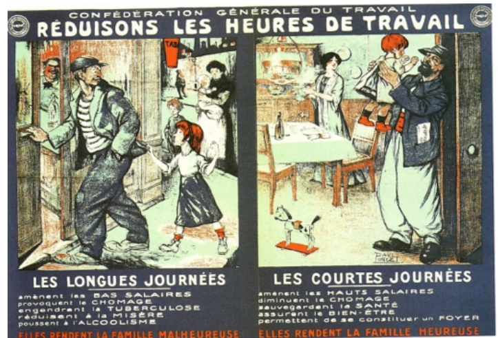
Affiche de la Confédération générale du travail (CGT) en 1895, année de sa création.