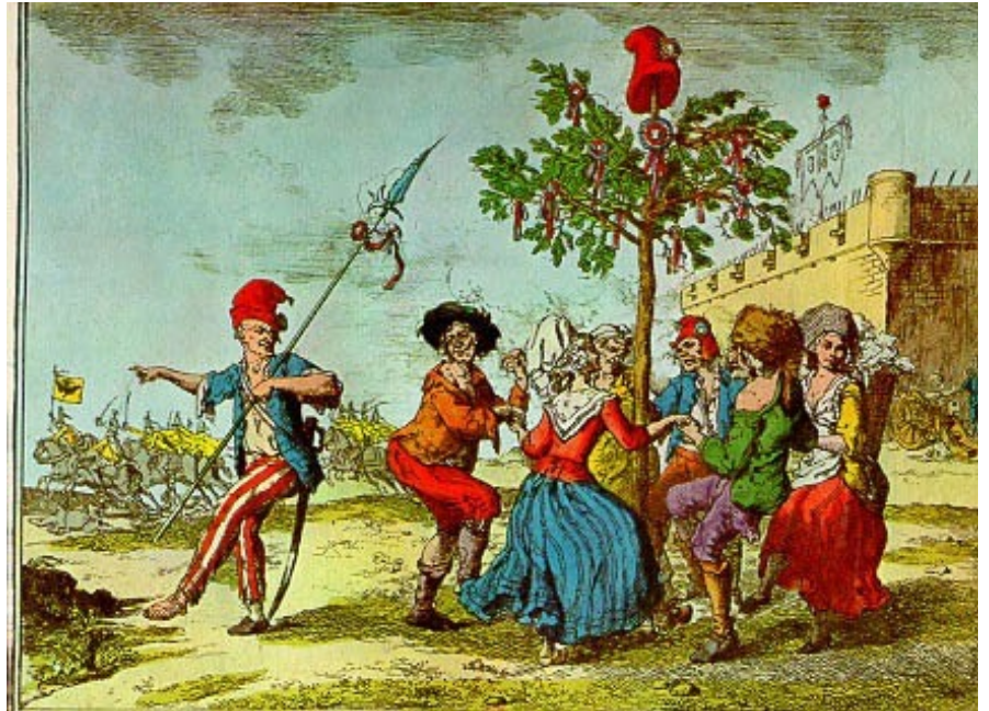
Devant la Bastille, les sans-culottes dansent autour de l'arbre de la Liberté.

Terreur : nom donné aux mesures politiques, économique et militaires prises pour sauver la Révolution