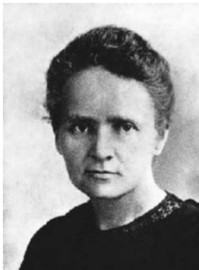
Marie Curie (1867 - 1934)

Marie Curie est une physicienne d'origine polonaise. Avec son mari, Pierre Curie, elle travaille sur la radioactivité. Elle est la première femme professeur en Sorbonne. Pendant la Première Guerre mondiale, elle crée un service de radiologie mobile pour les soldats.